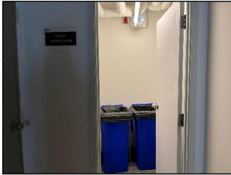
รูปที่ 1.10-1 ห้องพักมูลฝอยประจำชั้น