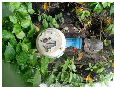
รูปที่ 1.7-1 มิเตอร์น้ำของโครงการ

พื้นที่โครงการอยู่ในเขตบริการของการประปานครหลวง สาขาพญาไท โครงการรับน้ำประปาจากการประปานครหลวง โดยมีจุดต่อเชื่อมต่อประปาใกล้กับทางเข้า-ออกด้านหน้าโครงการ น้ำประปาจะผ่านมิเตอร์น้ำ ดังรูปที่ 1.7-1 ของการประปานครหลวงเข้าสู่อาคารโครงการ โดยแต่ละอาคารมีถังสำรองน้ำ และระบบท่อส่งน้ำประปา