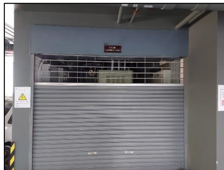
รูปที่ 1.11-1 ระบบไฟฟ้า

สำหรับระบบป้องกันฟ้าผ่า และสายดิน โครงการติดตั้งระบบป้องกันฟ้าผ่าแบบดั้งเดิม (Convention System) ประกอบด้วย หลักล่อฟ้า สายล่อฟ้า สายตัวนำ สายตัวนำลงดิน และหลักสายดิน ที่เชื่อมโยงกันเป็นระบบ